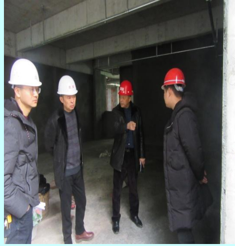
总经理（右二）、总工程师（左二） 检查工地