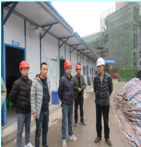
总工程师（右一） 检查工地