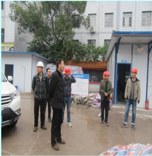
董事长（左二）、总工程师（左一） 检查工地