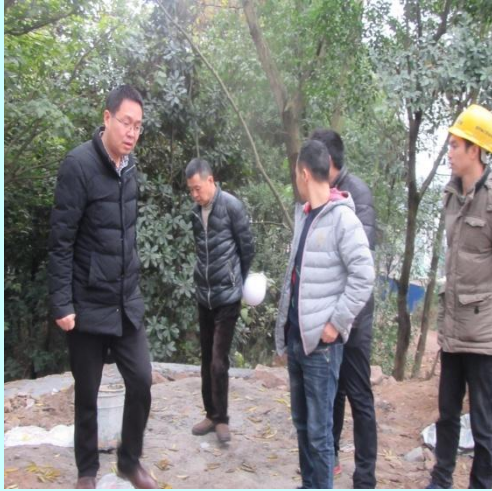
董事长（左一）、总工程师（左二） 检查工地