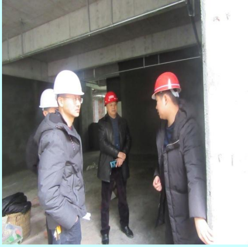
总经理（右二）、总工程师（左二） 检查工地