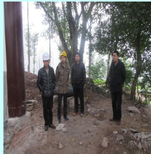
董事长（右一）、总工程师（左一） 检查工地