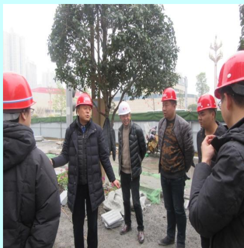
总经理（左二）、总工程师（左三） 检查工地