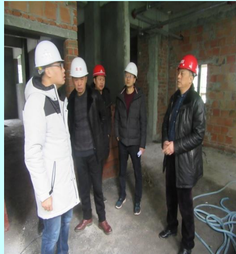
总经理（右一）、总工程师（左二） 检查工地