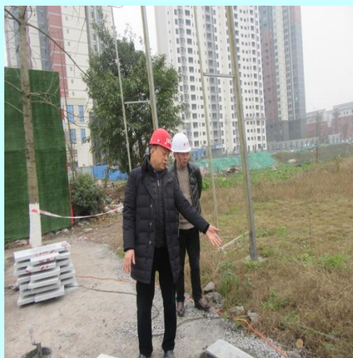
总经理（左一）、总工程师（左二） 检查工地