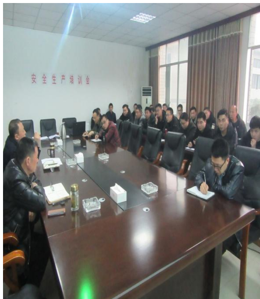
公司召开安全生产培训会