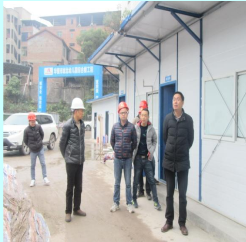
董事长（右一）、总工程师（左二） 检查工地