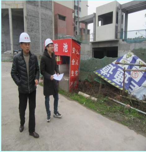
总工程师（左一）检查工地