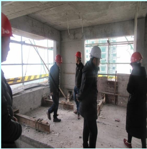
总工程师（右二）检查工地