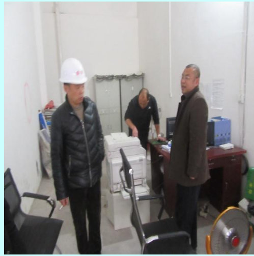
总工程师（左一）检查工地