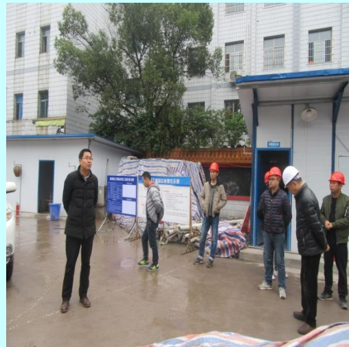
董事长（左一）、总工程师（右二） 检查工地