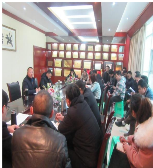
公司召开安全生产培训会