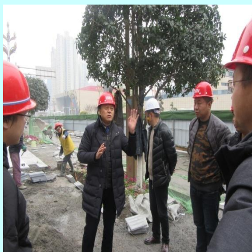
总经理（左二）、总工程师（左三） 检查工地