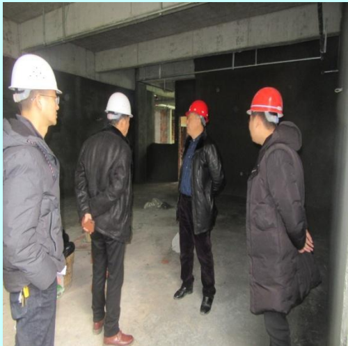
总经理（右二）、总工程师（左二） 检查工地