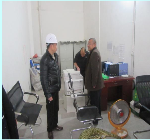
总工程师（左一）检查工地