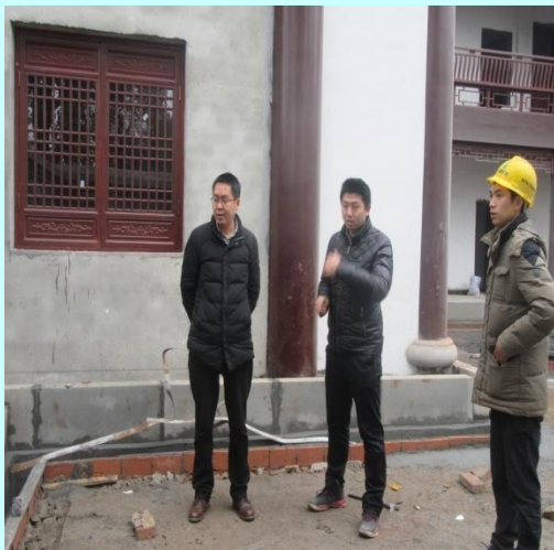
董事长（左一）检查工地